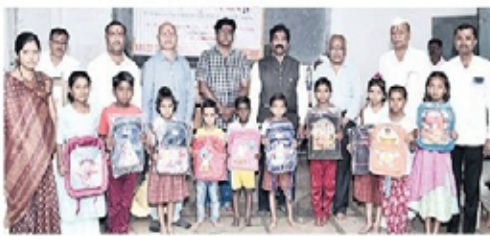
लातूर रोटरी क्लबच्या वतीने जेवळी येथे विद्यार्थ्यांना शालेय साहित्य वाटप करण्यात आले.